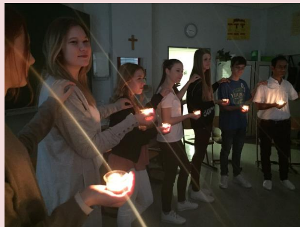
Lichtertanz in der Klasse S10 der Berufsfachschule für Sozialpflege